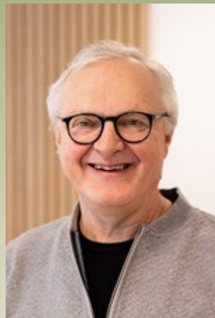
Thorkild Bjerregaard Midtjyllands kristne Friskole