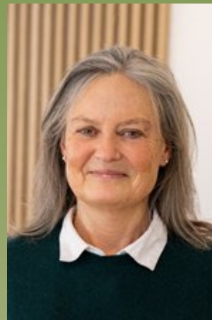
Helle Brinch Bagsværd Kostskole & Gymnasium