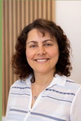
Selvere Oruc Sagsbehandler Vikar og Befordring